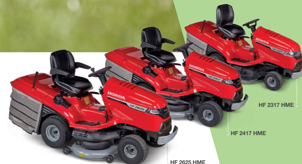
HF 2625 HME

Abbiamo anche pensato ai piccoli dettagli e questi modelli sono dotati di pneumatici con battistrada che aiuta a proteggere il prato, che non solo garantiscono una buona trazione, ma anche che non venga inflitto alcun danno antiestetico al prato stesso.