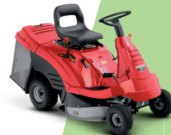
HF 1211 HE

Alimentati dai nostri motori "Pro", dotati di canna dei cilindri in ghisa e cuscinetti sull'albero motore per un funzionamento regolare e una maggiore durata del motore, sono facili da gestire grazie ad un unico pedale per il controllo della velocità di avanzamento. Sono inoltre altamente maneggevoli, con un raggio di sterzata stretto e un'eccellente visibilità così da rendere il taglio semplice e piacevole anche in presenza di ostacoli. Per risparmiare tempo e fatica durante il lavoro, è possibile vuotare il cesto raccogliherba pur rimanendo al posto di guida tramite l'azionamento di una sola leva facilmente raggiungibile.