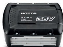
36V 9,0 Ah DPW3690XA