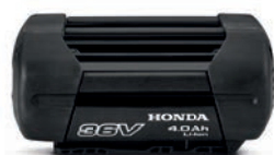
36V 4,0 Ah DP3640XA

Una selezione di batterie universali agli ioni di litio per la gamma cordless.