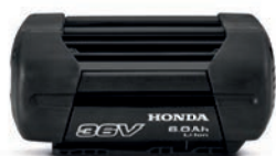
36V 6,0 Ah DP3660XA