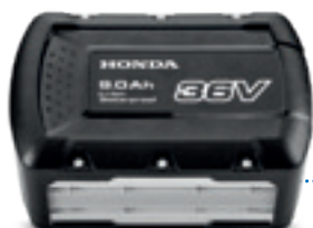
36V 9,0 Ah DPW3690XA