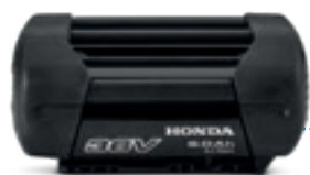
36V 6,0 Ah DP3660XA