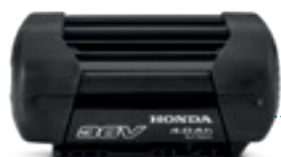
36V 4,0 Ah DP3640XA