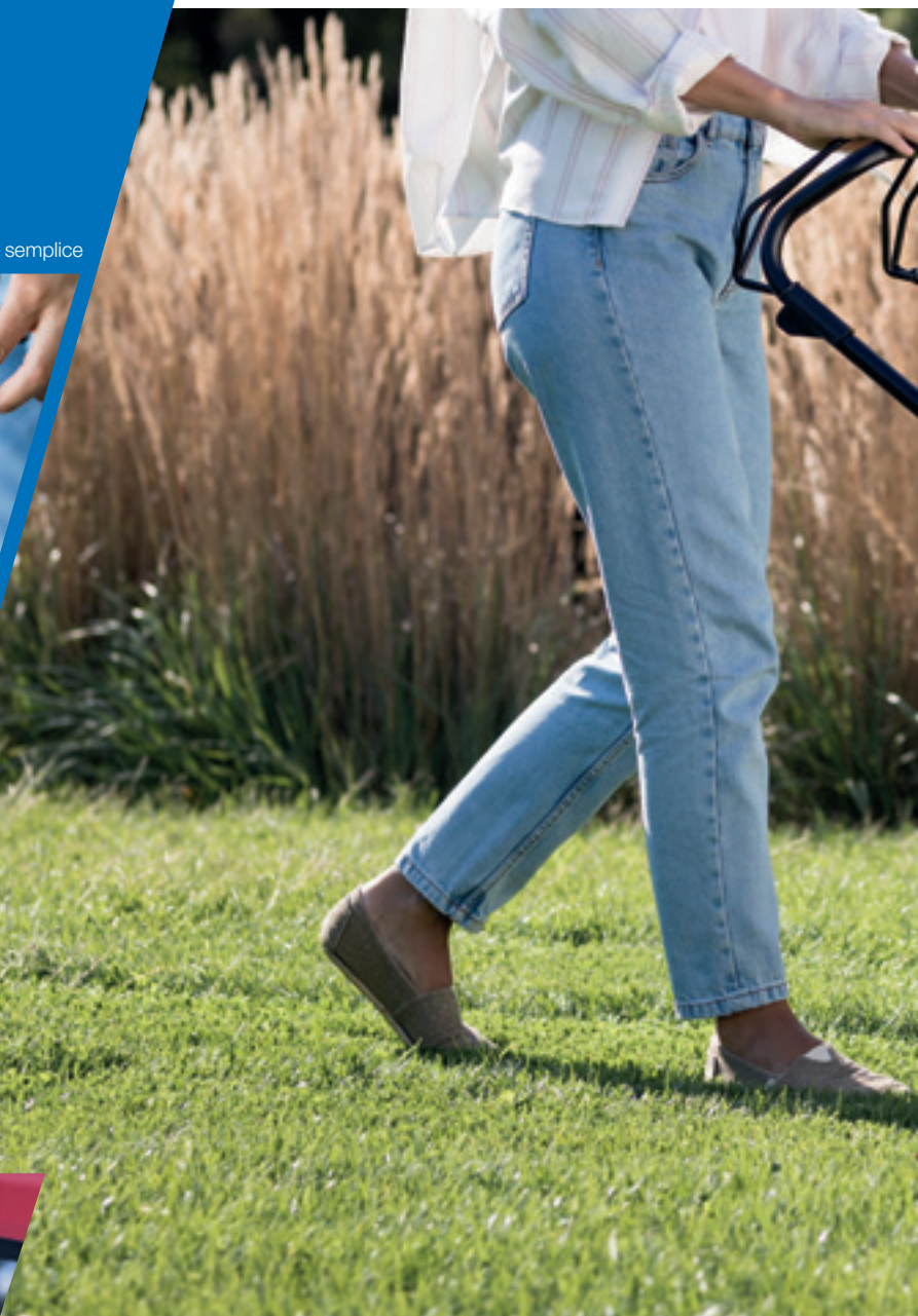
Sistema di mulching selettivo Versamow™