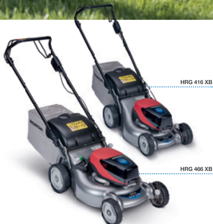
HRG 416 XB

Costruito per ridurre la manutenzione, include una sacca di raccolta ad alta portata d'aria per massimizzare la raccolta, regolazione dell'altezza del piatto di taglio flessibile e mulching selettivo Versamow™, in modo da potersi adattare alle esigenze di ogni giardiniere. Certificato IP54 per la resistenza alle intemperie, consente di tagliare l'erba bagnata in totale sicurezza e può lavorare anche sotto la pioggia.