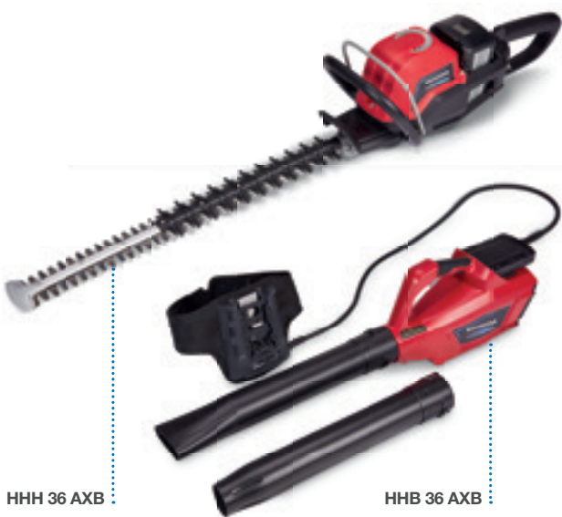
HHH 36 AXB