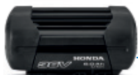
36V 6.0 Ah DP3660XA