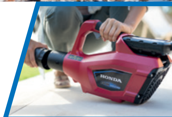
HHB 36 AXB