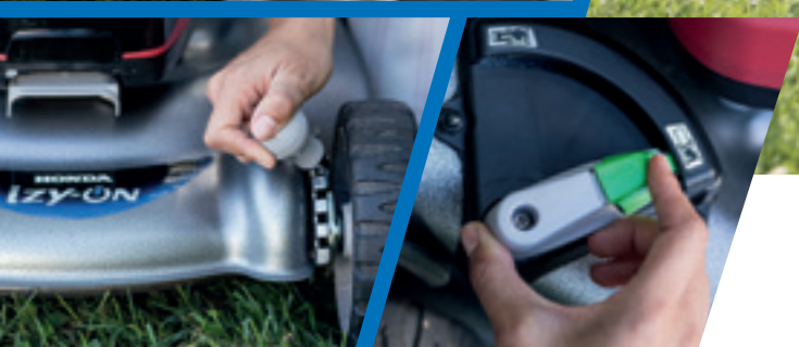
Regolazione dell'altezza del piatto di taglio