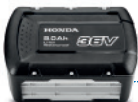
36V 9.0 Ah DPW3690XA