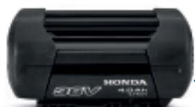
36V 4.0 Ah DP3640XA